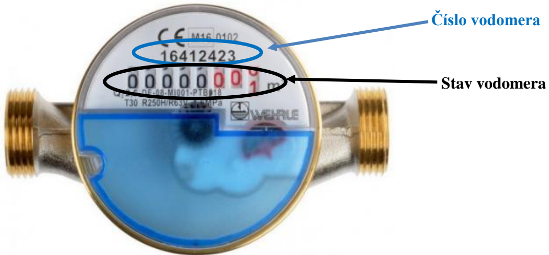
Obrázok 2 Vodomer Werhle - príklad

Na vodomere Werhle je číslo vodomera č. 16412423 a stav 0,001 m 3 . Čierne číslice sú m 3 na vodomere na obrázku je to 0 m 3 a červené čísla sú litre, na obrázku je to 1 liter, tie sa pri odpise nemusia uvádzať. Užívateľ pri odpise vodomera stačí ak uvedie iba čierne čísla. Na vodomere na obrázku je stav 0 m 3 .